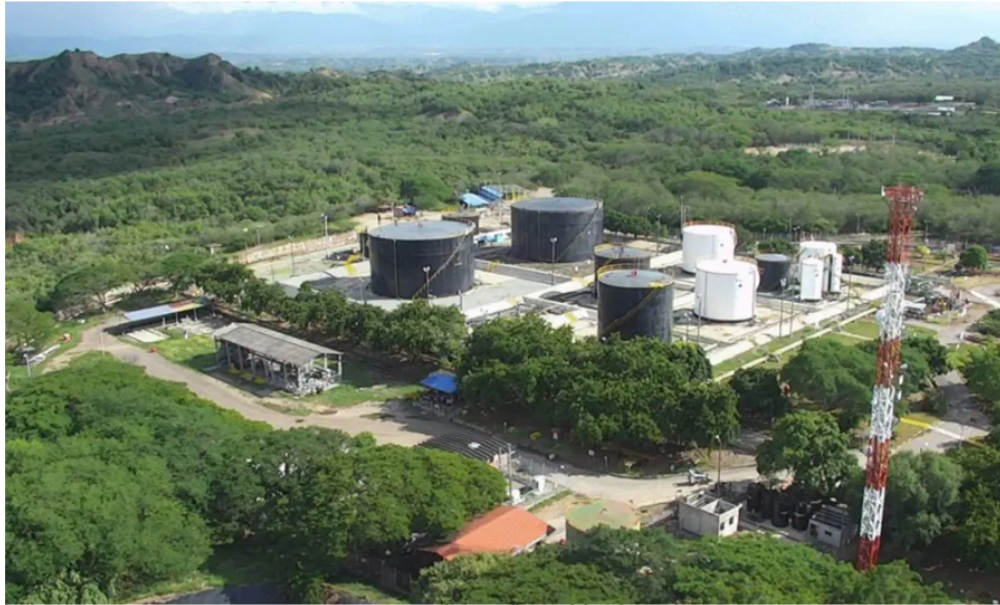
Campo Dina en Huila.

Con esta inversión, Ecopetrol impulsa la producción de hidrocarburos en los municipios de Neiva y Aipe.