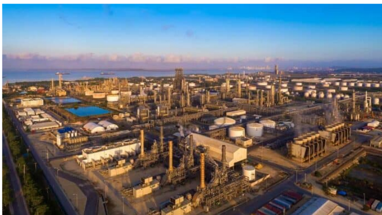
El plan de la Refinería de Cartagena para no quedarse sin energía.

La Refinería de Cartagena, propiedad del Grupo Ecopetrol , informó este miércoles -23 de octubre de 2024- que ha comenzado la implementación de un plan para mitigar los riesgos que afectan el suministro de energía eléctrica en sus instalaciones.