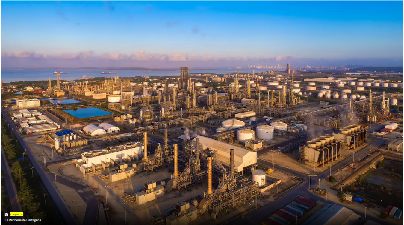
La Refinería de Cartagena.