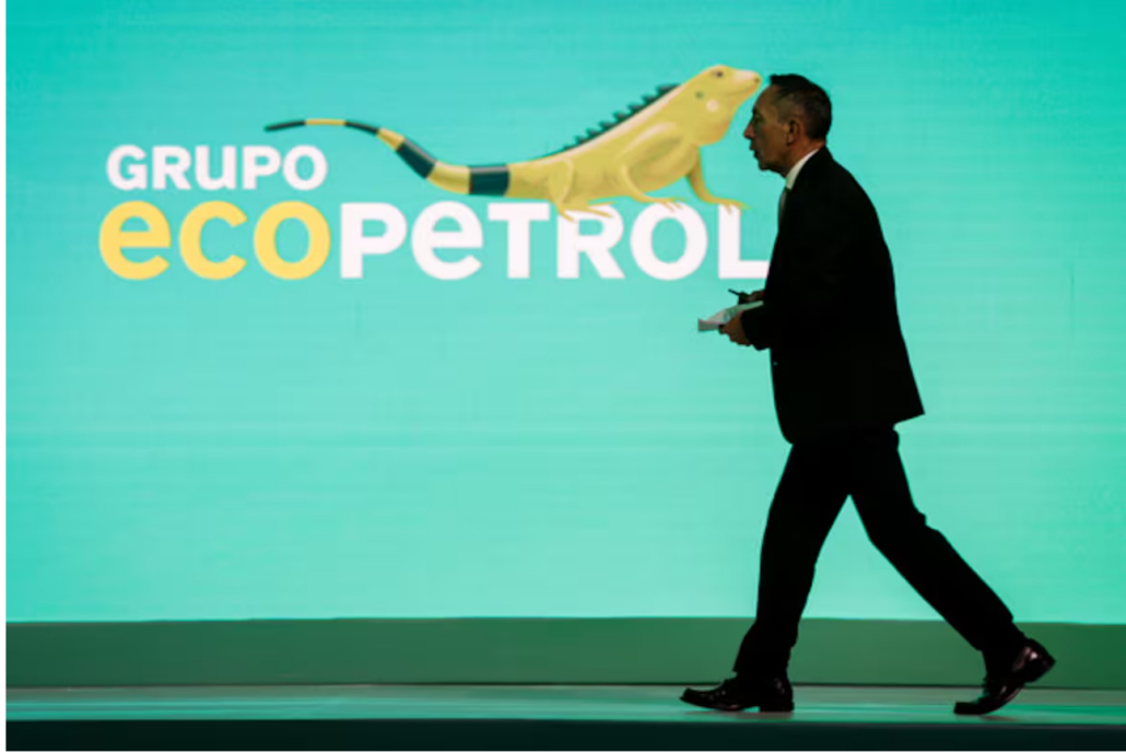
El crédito era de 500 millones de dólares.

La compañía entregó los resultados de la oferta de recompra de bonos que anunció el pasado 8 de octubre de 2024.