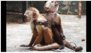
Medellín: Rescatan monos cariblancos que estaban encadenados