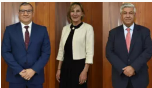
Consejo de Estado definió terna para magistrado de la Corte Constitucional