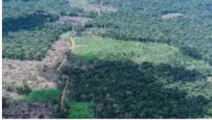
Procuraduría exhorta a fortalecer medidas contra el acaparamiento de tierras en la Amazonía