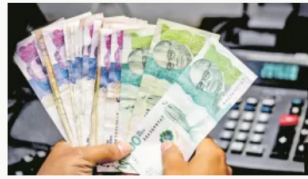
En dos semanas serán convocadas mesas de concertación para el salario mínimo de 2025