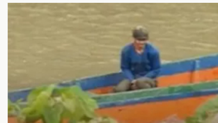
Reapareció 'Iván Mordisco': fue visto navegando por un río del Caquetá