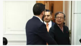
Nuevo conflicto entre Petro y Galán por el futuro del suministro de agua en la capital