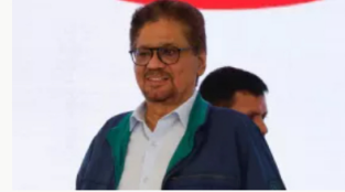
Gobierno Petro verifica la posible muerte de alias 'Iván Márquez' en Venezuela