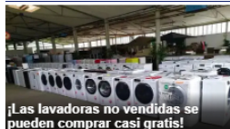
¡Las lavadoras no vendidas se pueden comprar casi gratis!