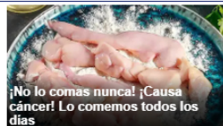
¡No lo comas nunca! ¡Causa cáncer! Lo comemos todos los días