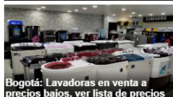
Bogotá: Lavadoras en venta a precios bajos, ver lista de precios