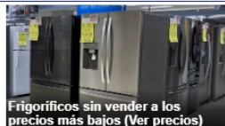
Frigoríficos sin vender a los precios más bajos (Ver precios)