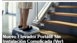
Nuevo Elevador Portátil Sin Instalación Complicada (Ver)