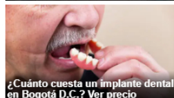
¿Cuánto cuesta un implante dental en Bogotá D.C.? Ver precio