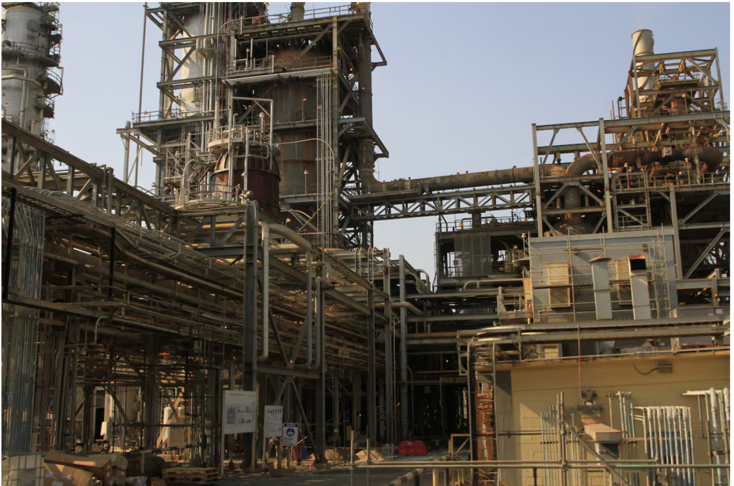
Refinería de Cartagena, propiedad de Ecopetrol .

La acción de Ecopetrol alcanzó precios que no se veían hace cuatro años en la Bolsa de Valores de Colombia. En Wall Street también tuvo una caída.