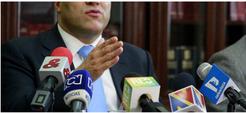
Name insiste que no acompaña por ahora recortar Ley de Garantías

“Estamos a valores del 2008, cuando lanzamos la acción y el Gobierno de Álvaro Uribe Vélez autorizó la venta de hasta un 20 % de las acciones de Ecopetrol . La acción salió en $1.800 en el 2008, y hoy está en $1.700. Todos los accionistas, incluidos los que compraron en la Bolsa de Nueva York, se han visto afectados, ya que la empresa vale un 50 % menos que en el 2008”, señaló Name, quien lamentó la crisis que enfrenta la empresa. Lea también: Ecopetrol cae en Wall Street y en la Bolsa de Valores de Colombia