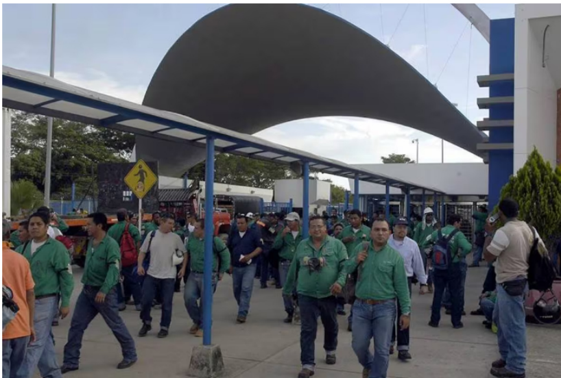
Miles de trabajadores de las distintas empresas contratistas de la refinería de Ecopetrol fueron ayer evacuadas tras un incidente en la Central Norte.

¿Cuál fue la petición que le hizo el presidente del CNE a la Fiscalía?