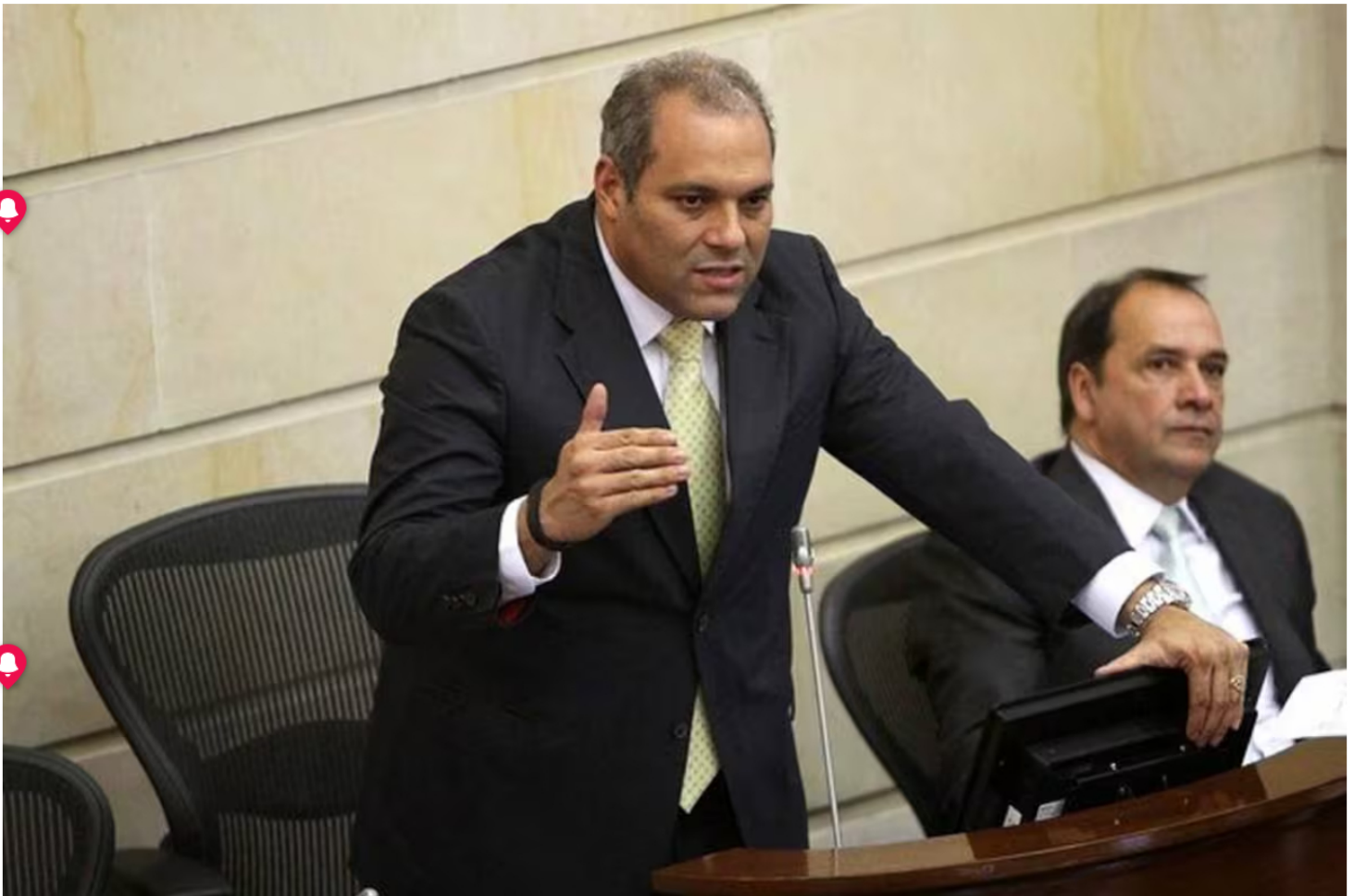
José David Name Cardozo, presidente del Congreso de la República.

El senador José David Name alerta sobre la caída de las acciones de Ecopetrol , que han alcanzado niveles no vistos en más de una década.