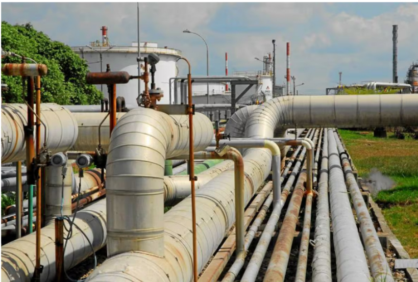
Después de un año, Ecopetrol sigue siendo el lunar en la agenda legislativa

“Estamos a valores del 2008, cuando lanzamos la acción y el Gobierno de Álvaro Uribe Vélez autorizó la venta de hasta un 20 % de las acciones de Ecopetrol . La acción salió en $1.800 en el 2008, y hoy está en $1.700. Todos los accionistas, incluidos los que compraron en la Bolsa de Nueva York, se han visto afectados, ya que la empresa vale un 50 % menos que en el 2008”, señaló Name, quien lamentó la crisis que enfrenta la empresa. Lea también: Ecopetrol cae en Wall Street y en la Bolsa de Valores de Colombia