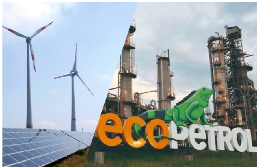
Ecopetrol cumple un papel protagónico en el logro de la urgente transición energética.