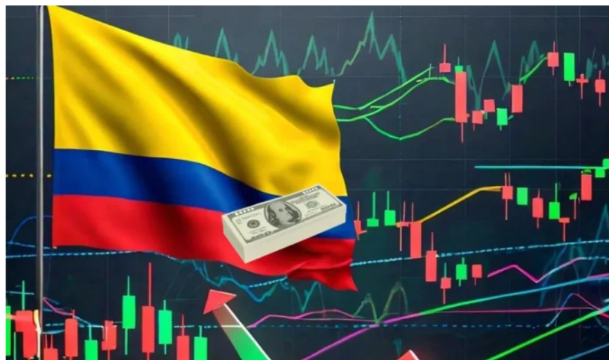
Semana movida en dólar, peso colombiano y BVC.

La BVC y el dólar subieron al mismo tiempo esta semana, donde se evidencia la presencia de compradores internacionales que quieren invertir en Colombia a largo plazo.