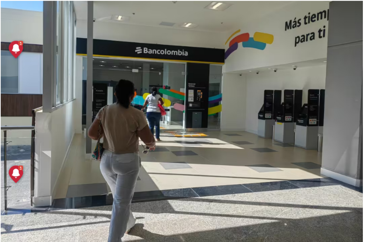
Bancolombia fue la empresa mejor calificada dentro del ranking.

La encuesta de reputación fue liderada por Merco Empresas Colombia 2024. Conozca cuáles quedaron en los primeros puestos.