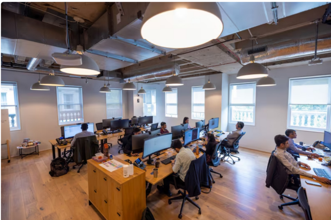
Estas son las empresas colombianas con mejor reputación en 2024

Esta semana se presentó el ranking Merco Empresas Colombia, que presenta las empresas con mejor reputación en Colombia. Para su elaboración, se contó con la participación de 1.821 directivos, 74 analistas financieros y 82 ONGs, entre otros