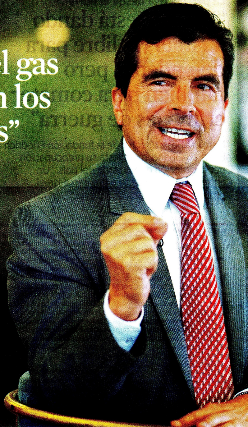
Orlando Velandia, presidente de la Agencia Nacional de Hidrocarburos y comisionado encargado en la CREG.

Orlando Velandia, presidente de la Agencia Nacional de Hidrocarburos (ANH), habló sobre el panorama del gas en Colombia y de Sirius, se refirió a una posible sobrecontratación de gas por parte de algunos agentes y dijo que en el país “no se está sacrificando la seguridad energética”.