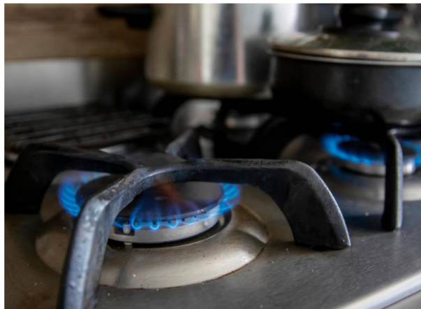
Sigue la incertidumbre por el futuro suministro y abastecimiento de gas en Colombia.

Según Ecopetrol, Canacol estaría generando un déficit grande en producción de gas.