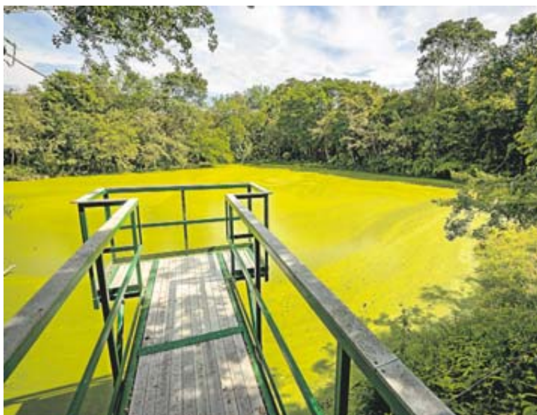
Ecoreserva La Tribuna

La COP16 que reunirá a más de 10.000 participantes de más de 100 países, será el escenario