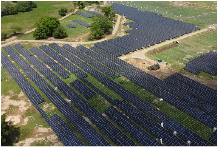
Barrancabermeja también lidera la energía solar en Colombia. Recientemente Ecopetrol inauguró la Granja Solar La Cira Infantes en el corregimiento El Centro, Barrancabermeja.