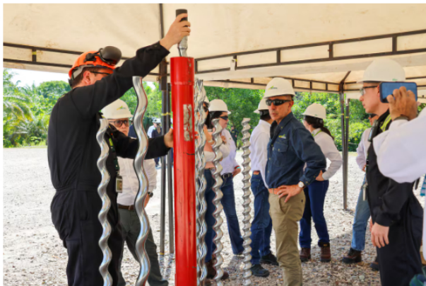
La Junta Directiva de Ecopetrol visitó el campo la Cira Infantas, el más antiguo de Colombia, donde funcionará la Granja Solar.

La pregunta para varios sectores de opinión es si estos proyectos efectivamente contribuyen a la sostenibilidad y el medio ambiente.