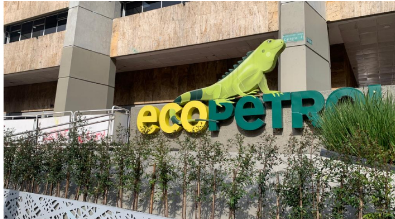
La Red de Veedurías cuestionó al Congreso por hacer lo que calificó como "aseveraciones politiqueras y espurias".

Publicado: Jueves, Octubre 17, 2024 - 08:28 | Actualizado: Jueves, Octubre 17, 2024 - 08:29