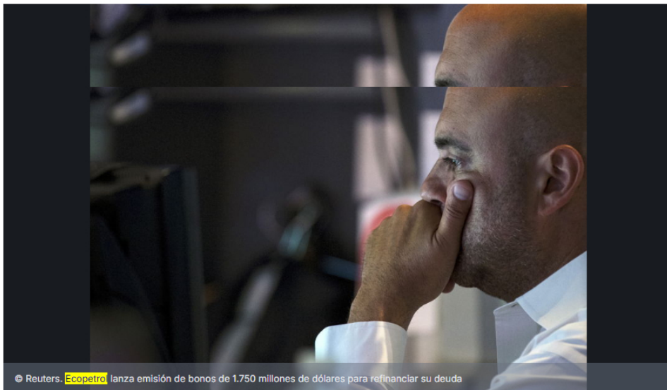
Ecopetrol lanza emisión de bonos de 1.750 millones de dólares para refinanciar su deuda