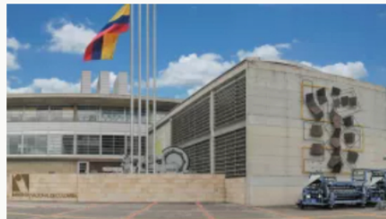
"Impresión de cédulas de extranjería no se ha suspendido:" Imprenta Nacional