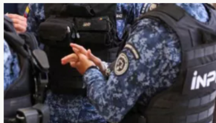
Violento ataque en Cauca: dos guardianes del Inpec y un recluso asesinados en emboscada