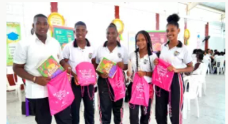
MinEducativa destina $505.000 millones para infraestructura educativa de universidades públicas