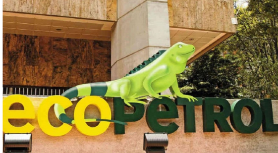
Ecopetrol registró una nueva caída en sus acciones en Wall Street Alcaldía de Bogotá

Publicado: Miércoles, Octubre 16, 2024 - 13:29 | Actualizado: Miércoles, Octubre 16, 2024 - 13:29