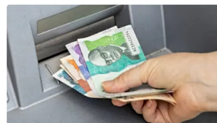
Aprende a invertir con inteligencia artificial con CFD