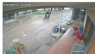
Video: en atentado sicaril un joven perdió la vida en