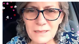
¿Murio la actriz Kristina Lilley, de Pasión de

Accede a los futuros de las bolsas internacionales Opera futuros en las principales bolsas globales y expande tus oportunidades. Tv Markets | Patrocinado