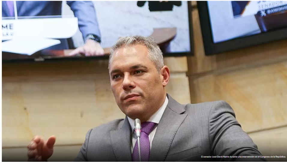
El senador José David Name durante una intervención en el Congreso de la República.