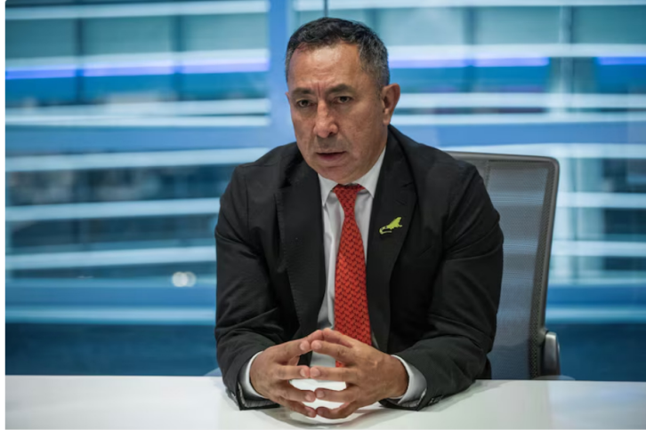
El 2024 podría ser el peor año para Ecopetrol durante la era Petro

Expertos consideran que, aunque esté en niveles de pandemia, hay espacio para que la acción de la estatal colombiana caiga otro poco en lo que queda de este año por cuenta de la incertidumbre en torno a la petrolera