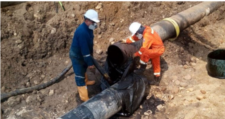
Cenit activa plan de emergencia por válvulas ilícitas en poliducto de Barrancabermeja.

Cenit, filial del Grupo Ecopetrol , informó recientemente que ha activado el Plan de Emergencia y Contingencia (PEC) del Poliducto Pozos Colorados – Galán, por presencia de trazas de hidrocarburo en el Caño San Silvestre, a la altura de la vereda Campo Gala, zona rural de Barrancabermeja, Santander, debido a la instalación de una válvula ilícita por terceros desconocidos.