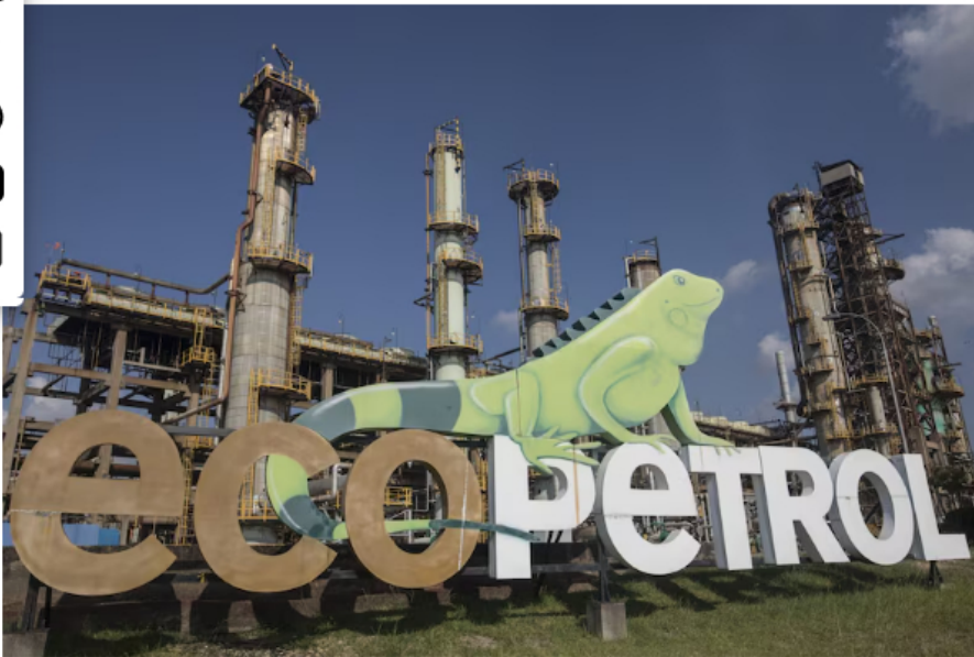
La Estrategia del Día: Acción de Ecopetrol , confianza del consumidor, tasa de interés

Por María C. Suárez | 16 de octubre, 2024 | 02:00 AM