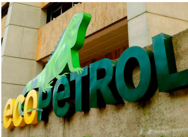
Ecopetrol Energía SAS fue creada para la comercialización de energía eléctrica, la cual fue constituida en marzo de 2018 con un capital autorizado de $3.000 millones.

La compañía informó que en su Asamblea de Accionistas se aprobó, con el 100% de los votos a favor, la liquidación oficial de la sociedad.