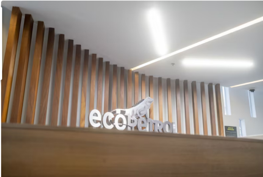
Ecopetrol recurre a préstamo de banco japonés tras posponer emisión de bonos

La petrolera colombiana utilizará un crédito de Sumitomo Mitsui para pagar parte de su deuda, en medio de una investigación política en Colombia