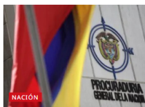
Según la Procuraduría, cada dos días muere un líder social en Colombia