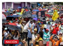
Fecode se declara en alerta y convoca movilización tras investigación del CNE a Gustavo Petro