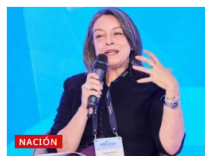
“No está claro en el Presupuesto Nacional cómo se van a pagar los subsidios”: Presidenta de Acolgen