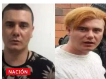
Pese a advertencias a juez que le dio casa por cárcel, se fugó alias 'Pichi, considerado 'El Pablo Escobar de Bucaramanga'