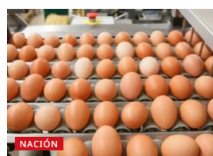
Fenavi donará 1 millón de huevos a familias vulnerables de Colombia