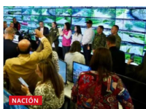
“Regresa a casa, por favor, regresa”: Llamado de MinTransporte en el puente festivo del Día de la Raza