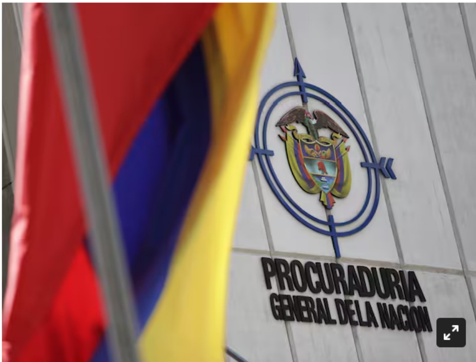
Procuraduría General de la Nación imagen de referencia.

La Procuraduría pidió a la ANLA levantar la suspensión del proyecto "Komodo-X1" en el Caribe, argumentando que la demora podría afectar la economía y la seguridad energética del país debido a la crisis hídrica y la inversión de más de 35 millones de dólares de Ecopetrol .