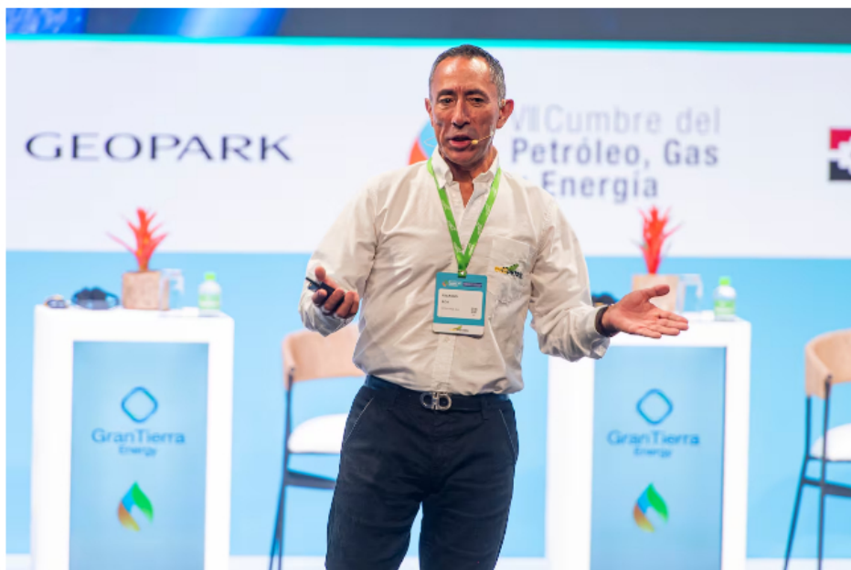
Ricardo Roa, presidente de Ecopetrol , en Cumbre de Petróleo, Gas y Energía, de la ACP y Campetrol.

La empresa aseguró que implementó medidas para garantizar el 100% de las entregas de diésel que se hace a los compradores mayoristas, pese a que los recientes ataques a las centrales de los hidrocarburos han afectado la capacidad de producción del combustible en la refinería de Barrancabermeja.