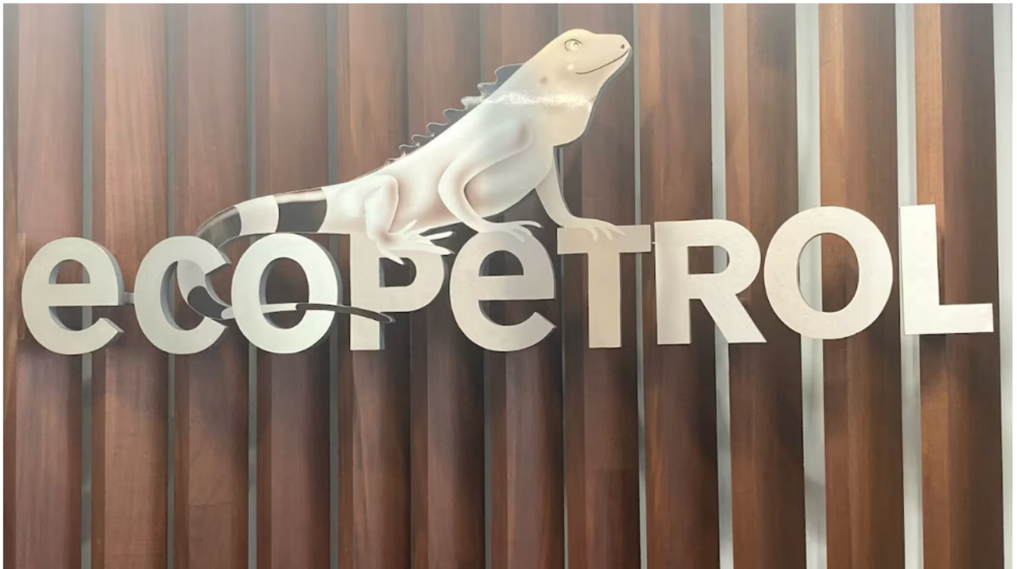
Ecopetrol , empresa responsable de estos pozos, emitió un comunicado en el que se refirió a la situación del diésel y el suministro del mismo.

Entre agosto y septiembre, el oleoducto Caño Limón - Coveñas, ubicado en los municipios de Arauca y Arauquita, en el departamento de Arauca, ha sufrido cerca de 19 atentados, que han afectado el funcionamiento del mismo. Las autoridades sospechan que los autores de los hechos habrían sido perpetrados por grupos al margen de la ley.