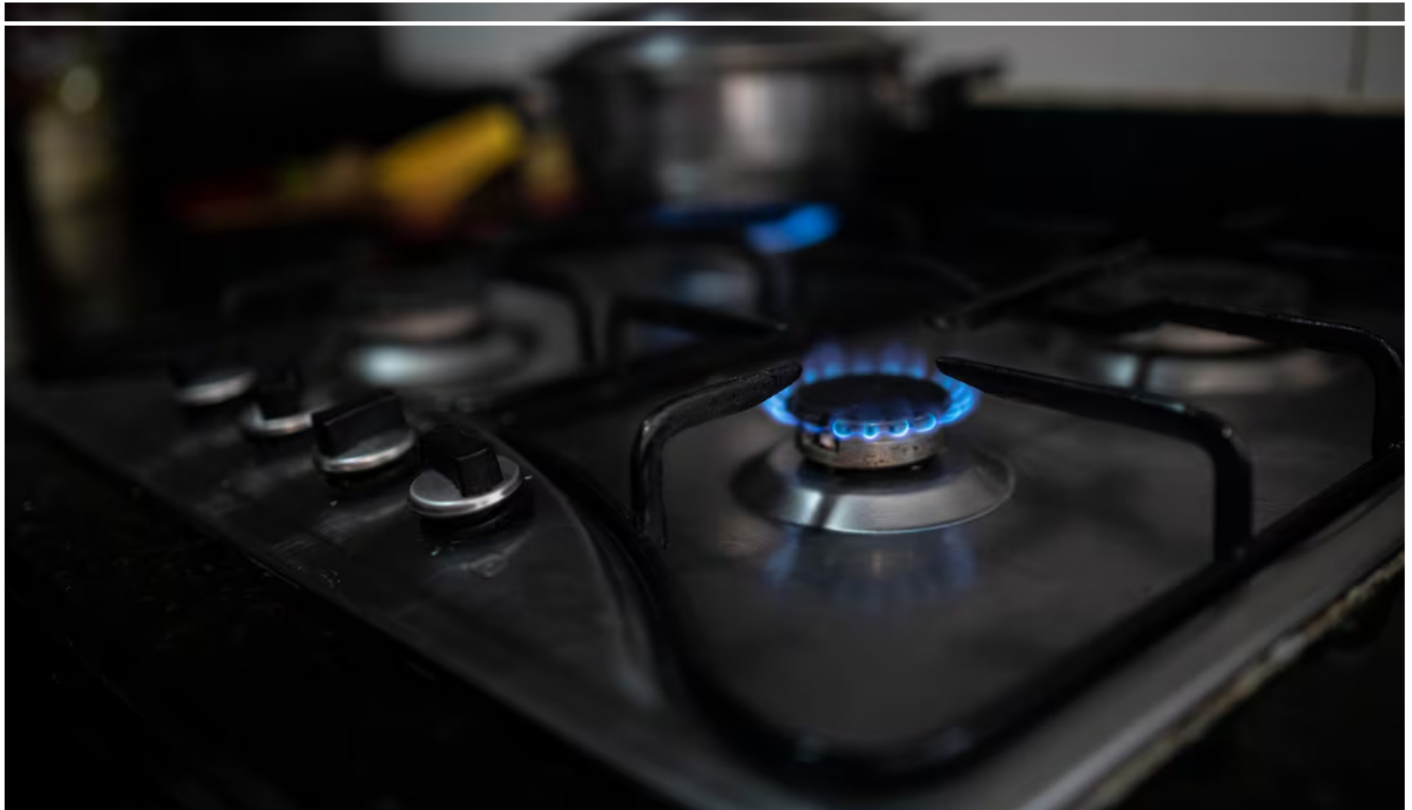
Gas natural, el gobierno acelera transición de Ecopetrol