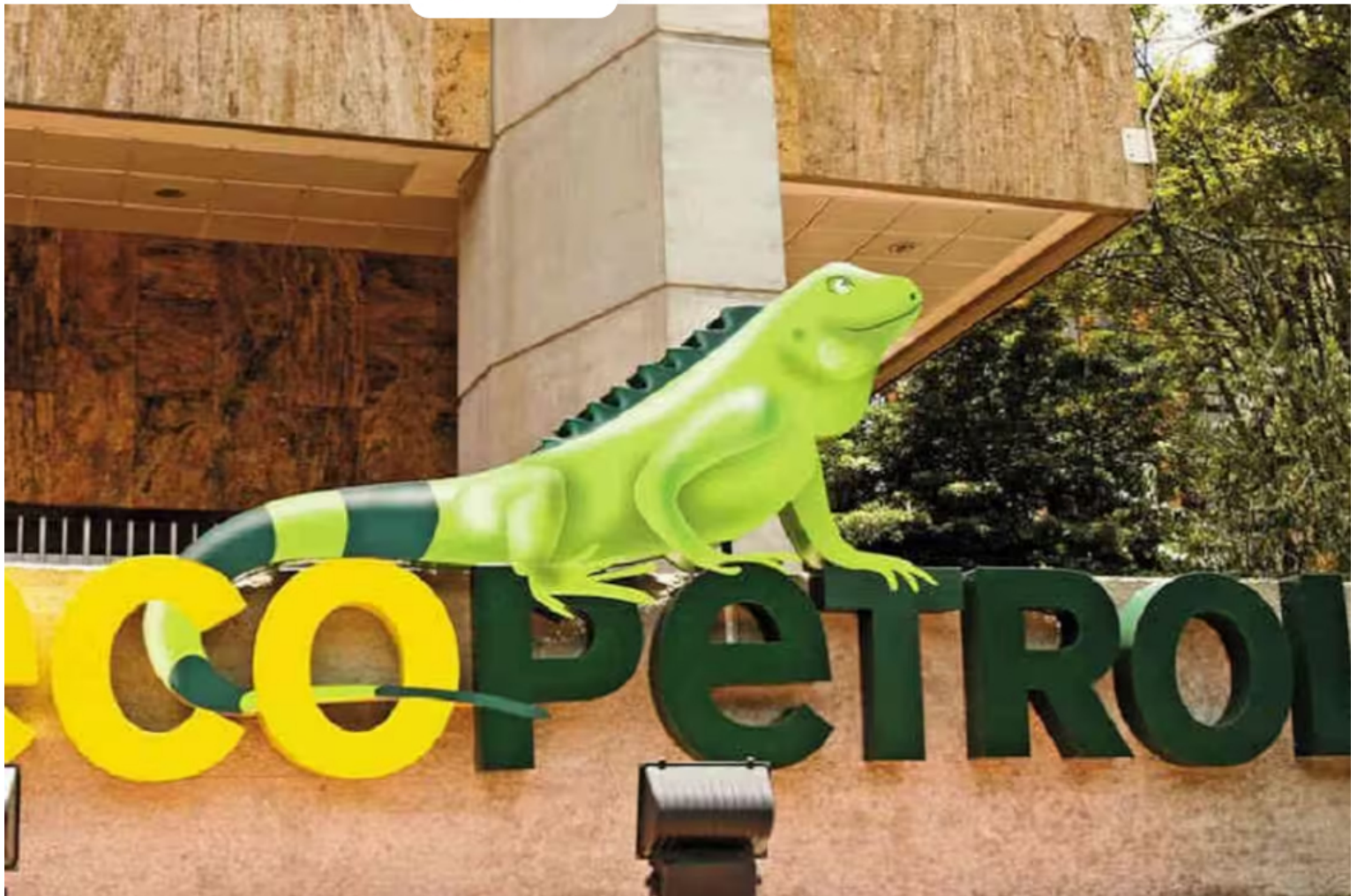
Logo de Ecopetrol. / Imagen de referencia