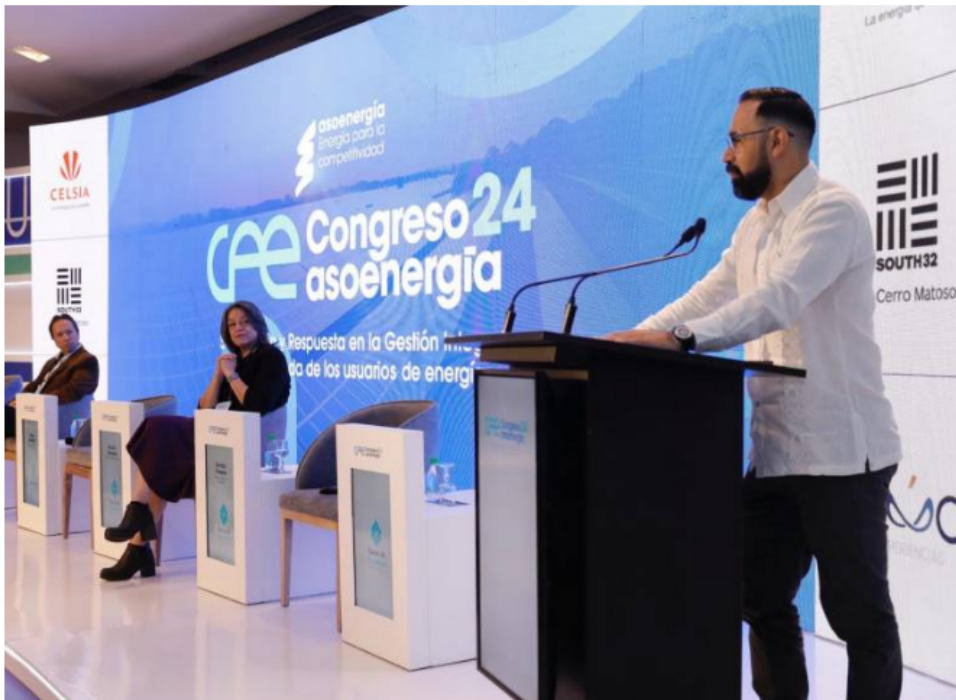
Ministro de Minas y Energía, Andrés Camacho.