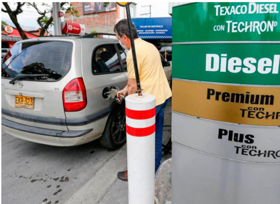
Ecopetrol garantizará con importaciones el suministro de biodiésel en Colombia.

La entidad ya había advertido que podría haber escasez dado a los bloqueos y atentados en los oleoductos de Caño Limón Coveñas.