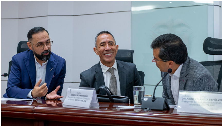
Gobierno acelerará la transición energética en Ecopetrol para liberar grandes volúmenes de gas y garantizar el abastecimiento interno

por TSM Noticias · 10 octubre, 2024 · 159 views · 4 mins read