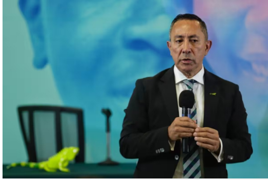
Ratifican a Ricardo Roa en la presidencia de Ecopetrol, pese a la investigación que el CNE abrirá contra la campaña de Petro Presidente, en la que Roa fungió como gerente