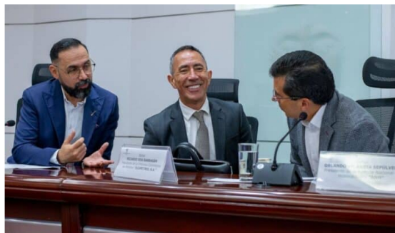
Buscan acelerar transición energética en Ecopetrol.

El Puesto de Mando Unificado de Gas (PMUG) analizó la situación del suministro de energía en Colombia debido a la crisis climática, y decidió acelerar la transición energética de la estatal Ecopetrol para liberar grandes volúmenes de gas natural que aseguren el abastecimiento en el país para los próximos años.