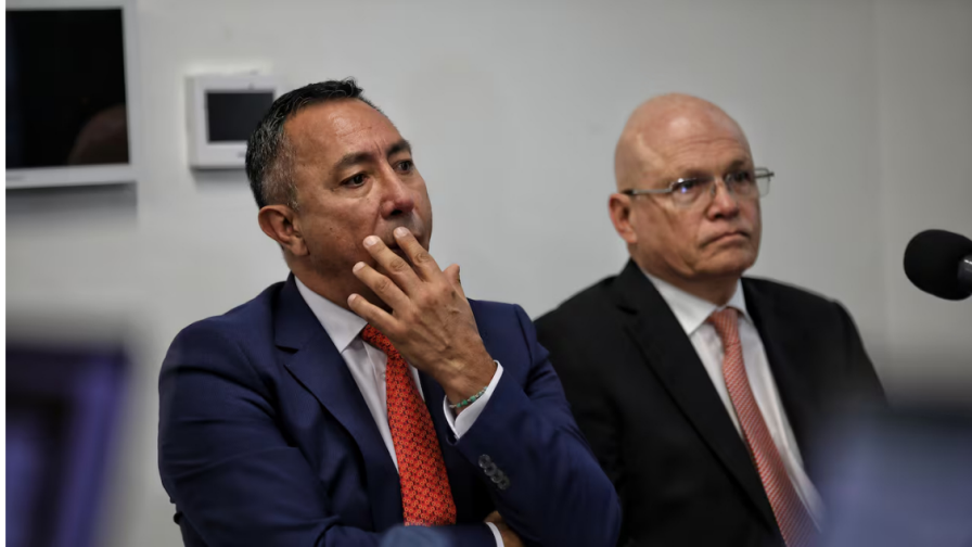
Ricardo Roa Barragán, presidente de Ecopetrol.

Ecopetrol ha vivido una verdadera crisis las últimas semanas. El problema energético al que se enfrenta Colombia, ante un posible desabastecimiento de gas, sumado a la guerra en Oriente Medio y el desplome de las acciones de la petrolera en la Bolsa de Nueva York y en la Bolsa de Valores de Colombia (BVC), han elevado las preocupaciones sobre el futuro de la empresa más próspera del país.