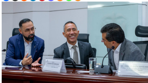
Gobierno acelerará la transición energética en Ecopetrol para liberar grandes volúmenes de gas y garantizar el abastecimiento interno

Ante los desafíos impuestos por la crisis climática y la creciente demanda energética, el Gobierno Nacional ha decidido acelerar el proceso de transición energética en Ecopetrol, con el objetivo de liberar grandes volúmenes de gas y asegurar el abastecimiento interno hasta 2026. Esta determinación se tomó en la reunión del Puesto de Mando Unificado de Gas (PMUG), que tuvo lugar en la Casa de Nariño este miércoles, encabezada por el presidente Gustavo Petro.