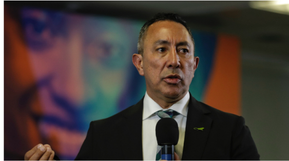
Ricardo Roa fue ratificado como presidente de Ecopetrol

Publicado: Miércoles, Octubre 9, 2024 - 13:26 | Actualizado: Miércoles, Octubre 9, 2024 - 13:53