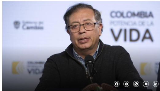
Gustavo Petro, presidente de Colombia.