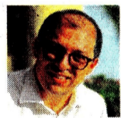
FRANCISCO BARBOSA Exfiscal General @BarbosaDelgado