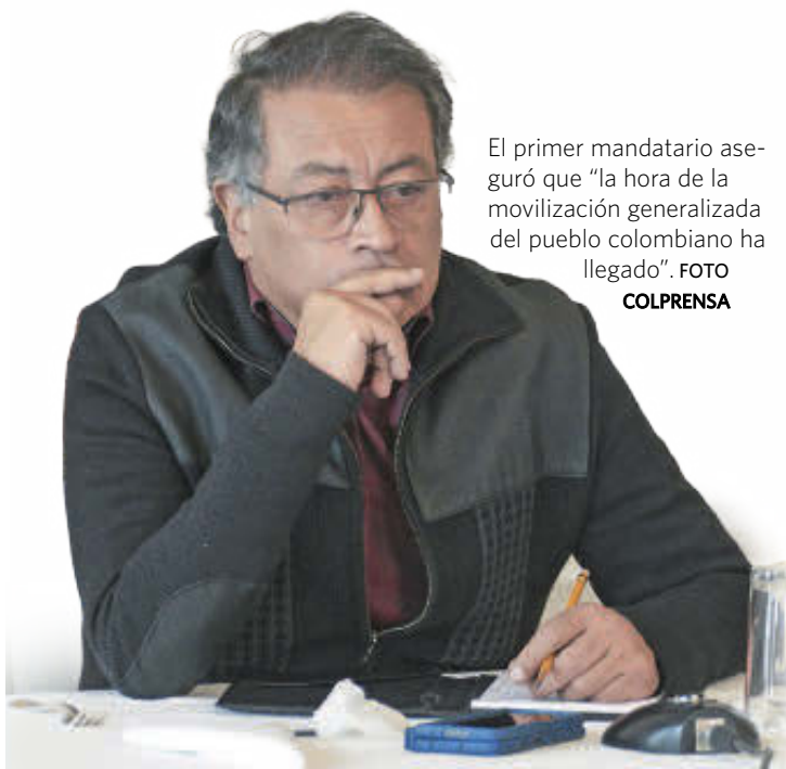
El primer mandatario aseguró que “la hora de la movilización generalizada del pueblo colombiano ha llegado”.

En medio de la avalancha de reacciones, el senador Humberto de la Calle negó que detrás del proceso haya un golpe blando. “Muchos presidentes han sido investigados sin que hubiera aflorado esa queja. Si no fuese así, estaríamos en el contrasentido de que las investiga-