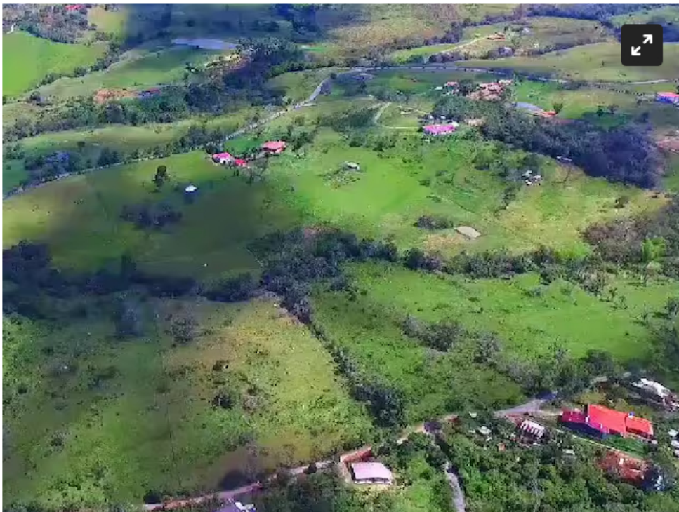
Este es el predio donde se construirá la subestación.

Dice la comunidad que esto les afectará ambiental, social y económicamente, por lo que se movilizarán en contra de su construcción