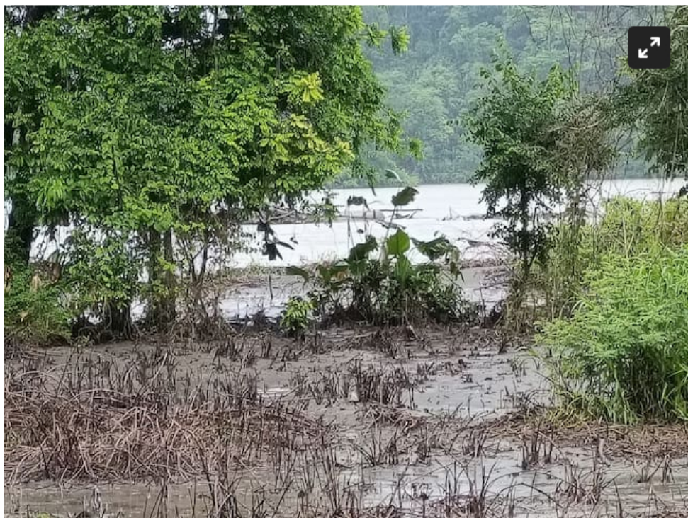
Los cultivos se han inundado por lo que ha hecho Cenit

Recordó lo que pasó una vez se creció el río. “Con una sola crecida del río se represó, lo devolvió, acabó con 15 hectáreas de la isla, se la llevó totalmente, inundó el resto de los terrenos, acabando con plátano, hay 26 familias aguantando hambre se les ha informado, se les ha dicho, los hemos llamado a hacer una conciliación en la Cámara de Comercio y nos dicen, nosotros no tenemos nada que hacer, nosotros somos una empresa pública del Gobierno y hagan lo que ustedes quieran hacer”.