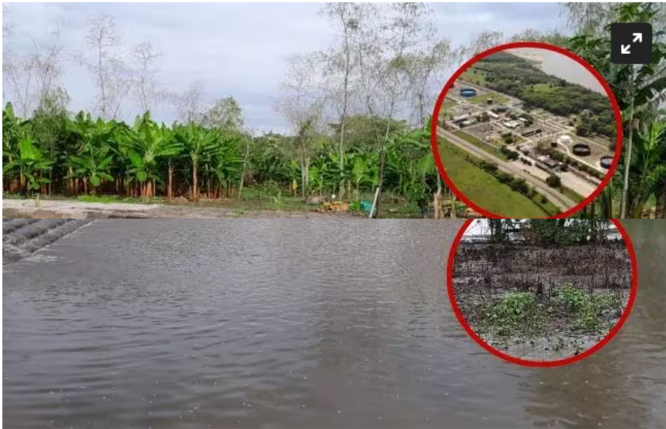
La comunidad denuncia que Cenit secó un brazo del río Magdalena.

La construcción de un dique sumergido para proteger la Planta de Vasconia