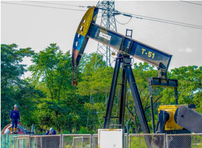
Fitch espera que la producción petrolera de Ecopetrol se establezca alrededor de 770.000 barriles diarios.

La petrolera recomprará bono internacional y emitirá nuevos bonos.