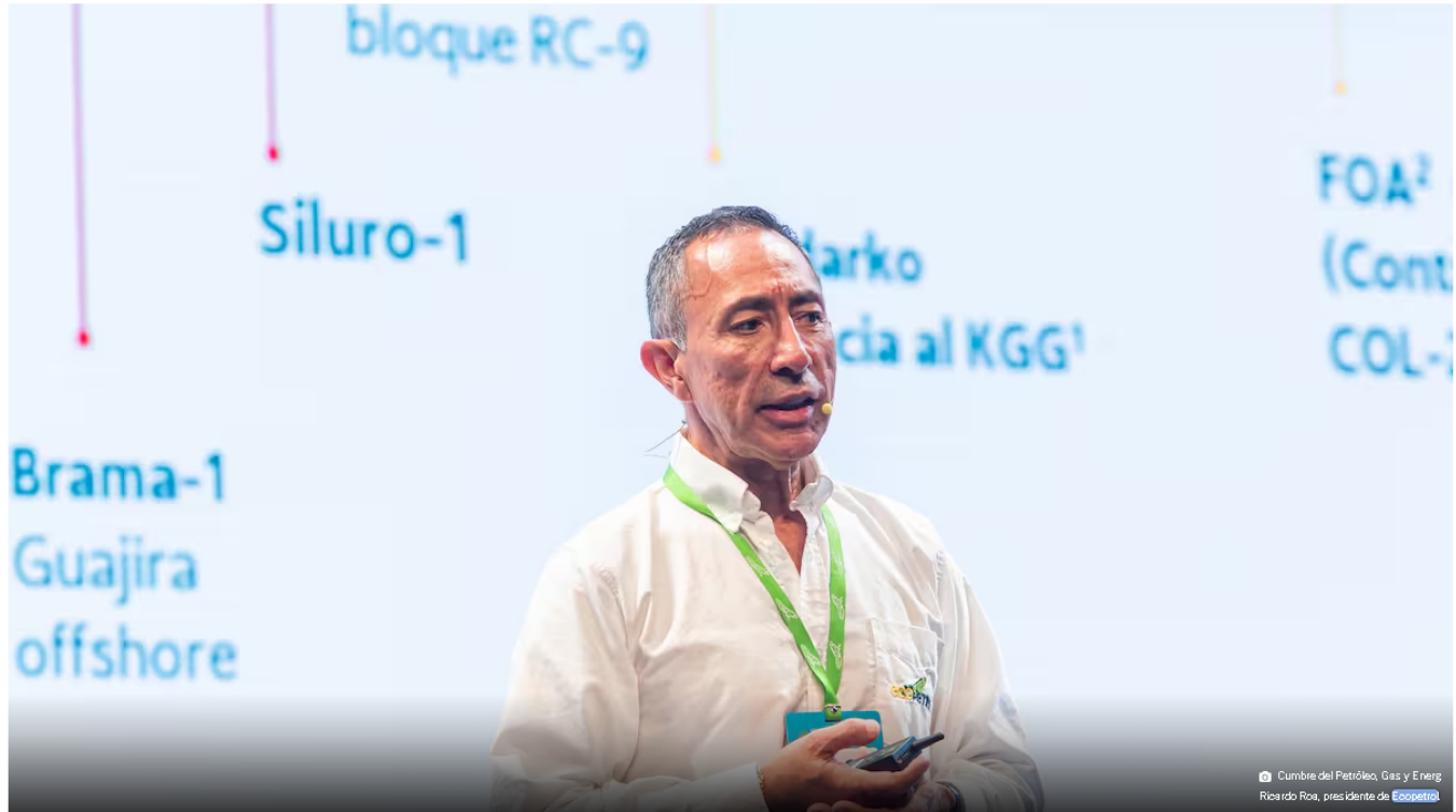
Cumbre del Petróleo, Gas y Energía Ricardo Roa, presidente de Ecopetrol