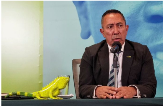
FOTO DE ARCHIVO. El presidente del grupo energético colombiano Ecopetrol, Ricardo Roa, habla durante una conferencia de prensa en Bogotá, Colombia, 24 de abril, 2023.

El descubrimiento de importantes reservas de gas natural en el pozo Sirius, anteriormente conocido como Uchuva, ubicado en aguas del Caribe colombiano, representa un avance significativo para la autosuficiencia energética del país.