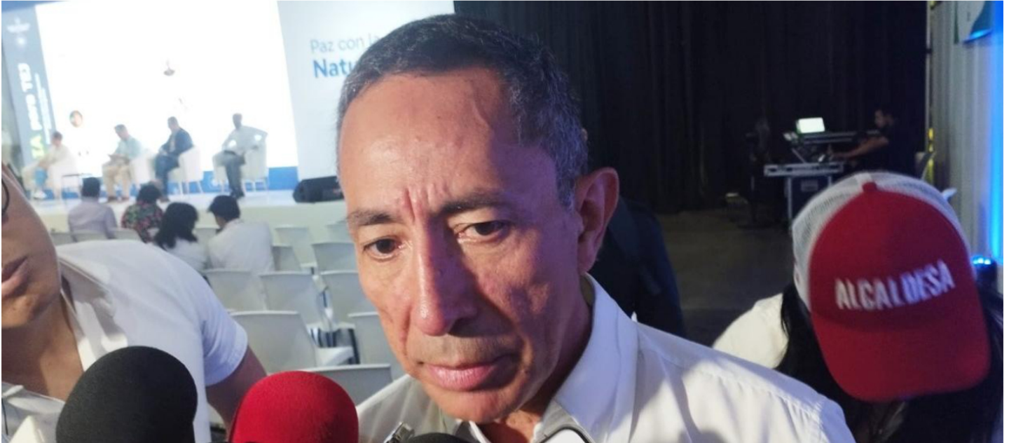
Ricardo Roa, presidente de Ecopetrol .