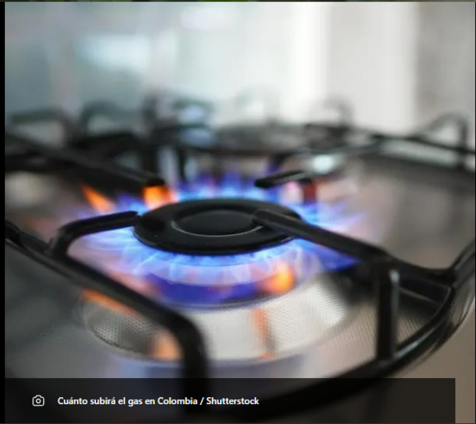
Cuánto subirá el gas en Colombia