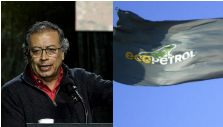
Petro le pidió a Ecopetrol "sacarse el petróleo de la cabeza".

¿Polémico? El presidente le propuso a la compañía una nueva fuente de ingresos.