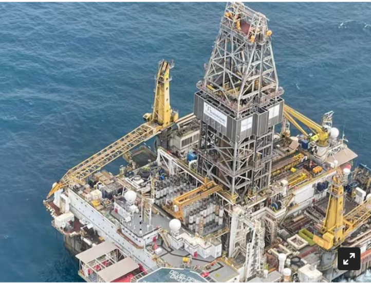
Pozo Uchuva 2 Ecopetrol Ecopetrol

Petrobras en su análisis de igual forma, expuso que para el próximo año, Colombia podría tener un déficit de gas de 10%.