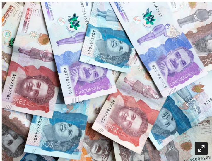
Dinero, imagen de referencia