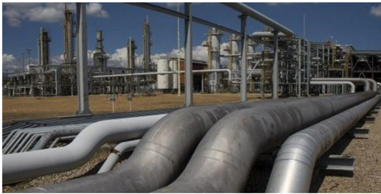
El campo Sirius le permitirá a Colombia tener seguridad energética por décadas, tal y como pasó en su momento con el campo Cusiana.

En resumen, el ejecutivo destacó que América del Sur (Colombia y Brasil) tienen desafíos diferentes a los de los demás continentes y, por lo tanto, nuevas reservas de petróleo y gas son estratégicas para la seguridad y soberanía energética.