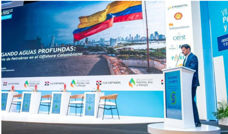
Rogerio Soares, gerente general de activos exploratorios de Petrobras Colombia.

El directivo resaltó que, junto a Ecopetrol , lograron el principal descubrimiento de gas offshore del país con el proyecto Sirius (antes Uchuva) y confirmó que tiene un potencial de seis terapias cúbicas por día.